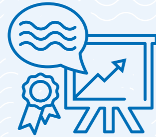
Seminare &amp; Schulungen