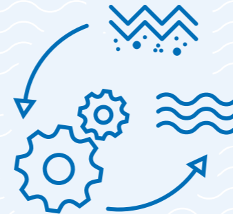
Anlagen zur Wasseraufbereitung